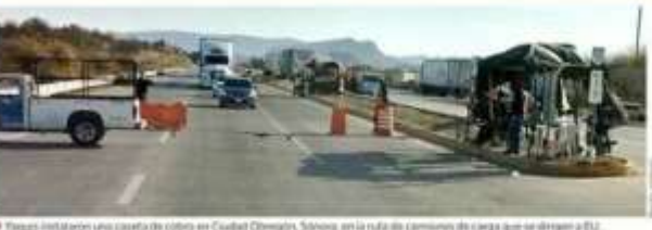
Trasas instalaron una caseta de cobro en Ciudad Obregón, Sonora, en la ruta de camiones de carga que se dirige a EU.

Desiste gobierno de impedir ocupación de puntos de peaje