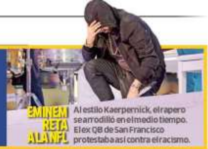
EMINEM RETA A LA NFL

Al estilo Kaepernick, el rapero se arrodilló en el medio tiempo. El ex QB de San Francisco protestaba así contra el racismo.