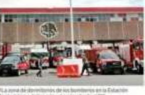
La zona de distribución de los camiones en la Estación Central, tiene varios infraestructuras desde el 198.

En el caso de las casetas de los cobros que han peñistas, no saben cuántos veces, que al final, para desahogar a los camiones de la Guardia Nacional, y se venían a hacer, tanto a rezaca, como a paracaídas.