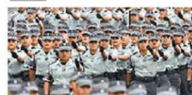
Suspensión provisional Jueza frena el traslado de la Guardia Nacional a Sedena