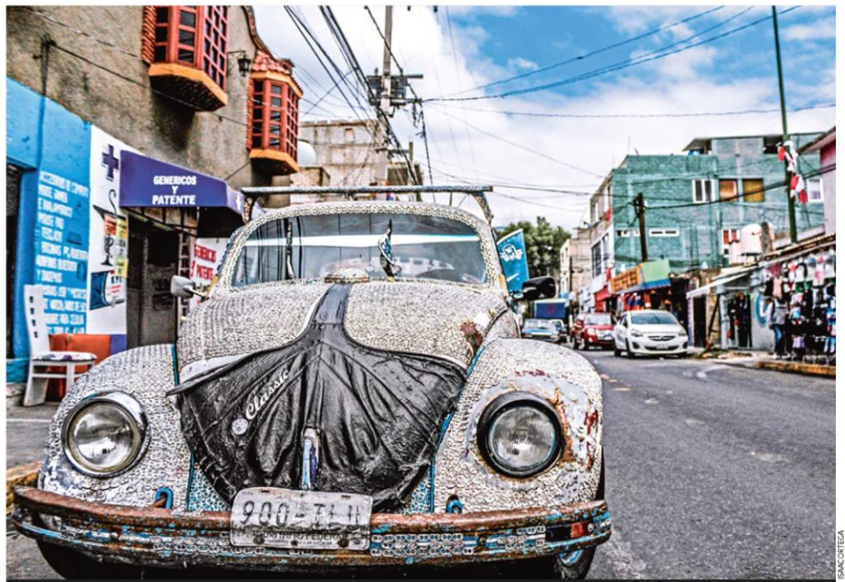
SOBREVIVIENTES. Como en una vuelta al pasado, en Cuauhtémoc el servicio de taxis se ofrece mediante pintorescos vochitos de todos los colores; apenas fueron regulados por las autoridades CDMX P. 10

#GuacamayaLeaks El grupo criminal encabezado por los hijos del Chapo y del Mayo Zambada reclutan a profesores universitarios para desarrollar sus propios precursores químicos, no depender del fentanilo de China y crear uno mexicano; las pruebas de esa sustancia ya se han distribuido en Japón, Australia, Canadá y Estados Unidos, de acuerdo con documentos hackeados al Ejército por Guacamaya, a los cuales tiene acceso 24 HORAS MÉXICO P. 3