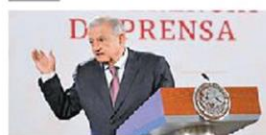
Pide apoyo a Congresos AMLO aplaude a Adán por voto priista al plan militar

“Lo que está haciendo el Presidente es que la participación de las fuerzas armadas sea conforme a la ley”, expuso el canciller sobre las labores de seguridad. PÁGS. 6 Y 7