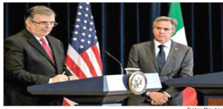
Ebrard y Blinken encabezaron el Diálogo de Alto Nivel, en EU.

POR ENRIQUE SANCHEZ Y DAVID VICENTEÑO La reforma que extiende a 2028 el apoyo de las Fuerzas Armadas en seguridad pública no implica una militarización, aseguró el canciller Marcelo Ebrard. Tras reunirse con funcionarios de Estados Unidos en el Diálogo de Alto Nivel, dijo que esta tarea es conforme a la ley y no opaca, como en anteriores gobiernos. También defendió que la Guardia Nacional se haya integrado a la Sedena. "No se quiere que quede una ambigüedad como fue la Policía Federal. El titular de la Policía Federal está sujeto a proceso en Nueva York: Genaro García Luna", subrayó en Washington. Ebrard rechazó que con la Guardia exista un mayor riesgo de violaciones a los derechos humanos. "El número de reclamos que hay en la Comisión Nacional de Derechos Humanos de la Guardia Nacional es mucho más bajo que cualquier policía del país, hoy en día", sostuvo. El secretario de Estado de EU, Antony Blinken, reconoció que hace falta trabajo de su gobierno contra el tráfico de armas.