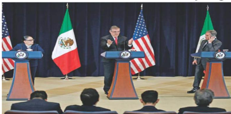
Rosa Icela Rodríguez titular de Seguridad, el canciller Marcelo Ebrard y Antony Blinken secretario de Estado.