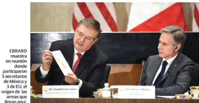
EBRARD muestra en reunión donde participaron 5 secretarios de México y 3 de EU, el origen de las armas que llegan aquí.

EN DIÁLOGO de Alto Nivel Ebrard exhibe origen de armamento que llega aquí; decomisan 32 mil; justifica a GN, "imposible que viole derechos" pág. 3