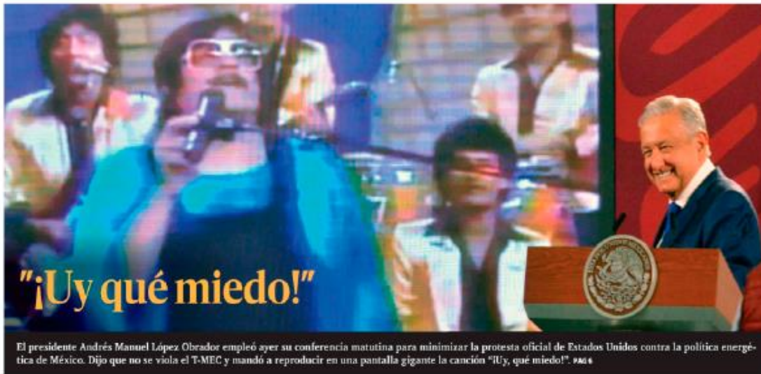
El presidente Andrés Manuel López Obrador empleó ayer su conferencia matutina para minimizar la protesta oficial de Estados Unidos contra la política energética de México. Dijo que no se viola el T-MEC y mandó a reproducir en una pantalla gigante la canción "¡Uy, qué miedo!". PÁG 6