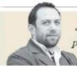
Maruan Soto Antaki "Frente a la emergencia planetaria, defensa de la deforestación" - P. 3

T-MEC. Confirma EU llamado a solución de disputa por disposiciones energéticas, pero López Obrador desestima el caso y dice que Seade "no ve violación"; Economía buscará una salida que satisfaga a todos