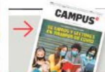
De libros y lectores en la era del covid La cultura escrita