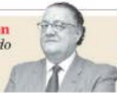
Jorge F. Hernández "Temurita de buena onda o canción de Silvio 40 años después" - P. 20