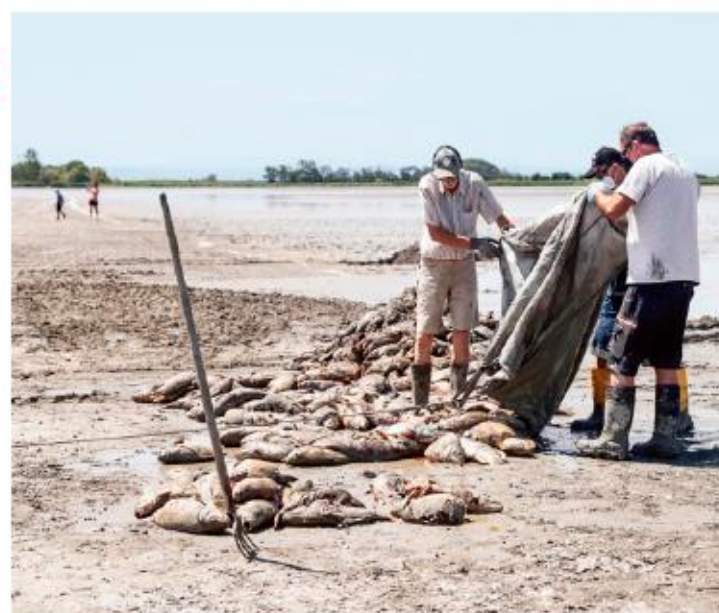
PAISAJE ÁRIDO. La canícula que azota a Europa secó el lago Zicksee en Austria y provocó la muerte de cientos de peces. Trabajadores limpian la zona con redes e incluso maquinaria pesada.

GREENPEACE AMPLIARÁ RECURSO LEGAL PARA FRENAR AL TREN MAYA MEXICO P. 3