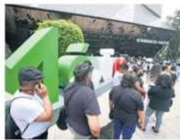
El SAT quiso presentar como un mito las largas filas que se veían a diario, dijeron expertos.

Es un respiro para quienes indirectamente necesitaban la constancia para otros fines, como cerrar un negocio o firmar el