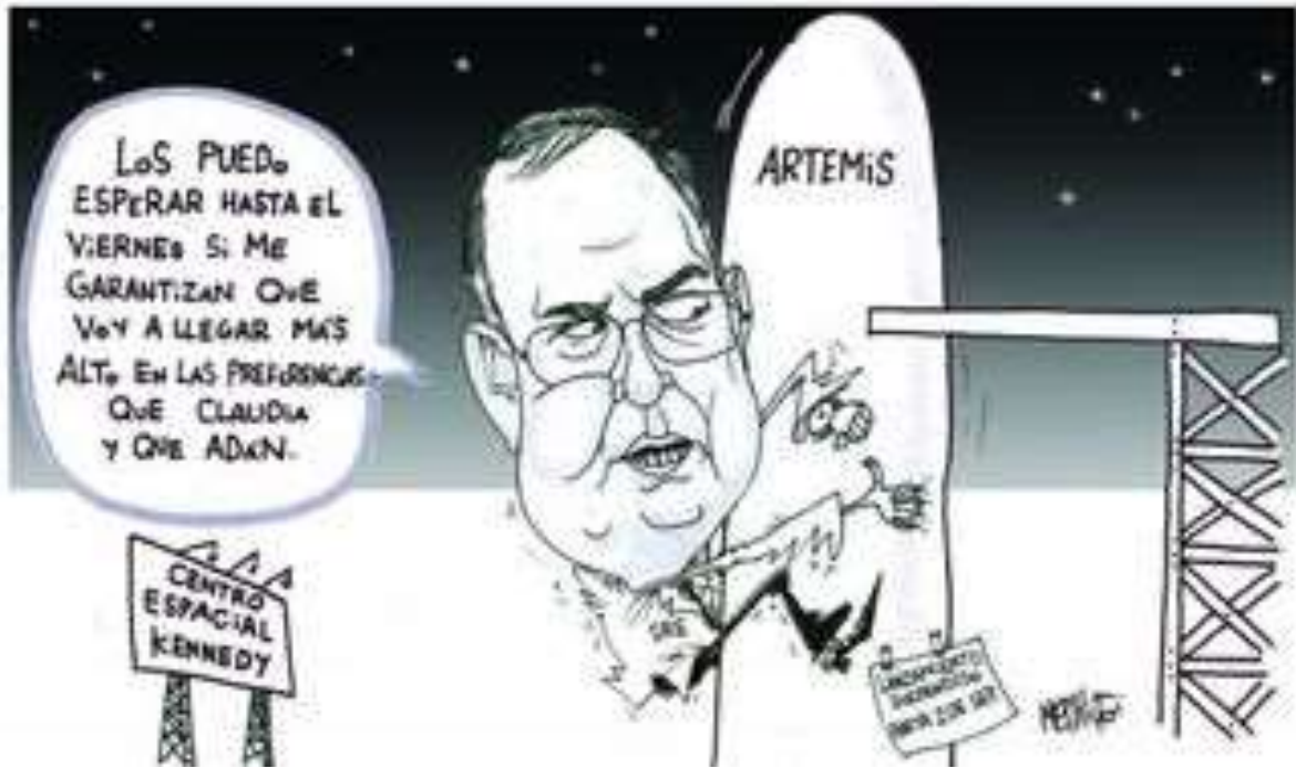
MONSI / LA LENGUA AL PODER