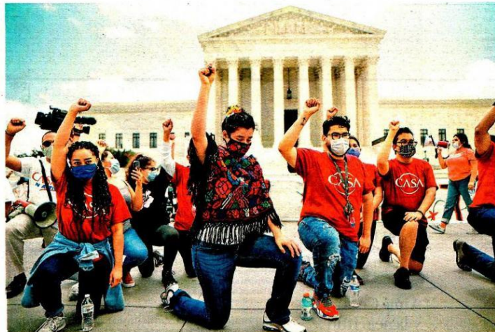
Chicos adscritos al plan creado por Barack Obama en 2012 también apoyan la protesta antirracista.