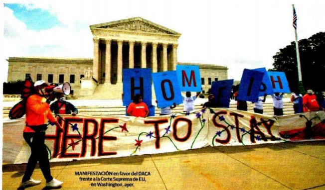
MANIFESTACIÓN en favor del DACA frente a la Corte Suprema de EU, en Washington, ayer.