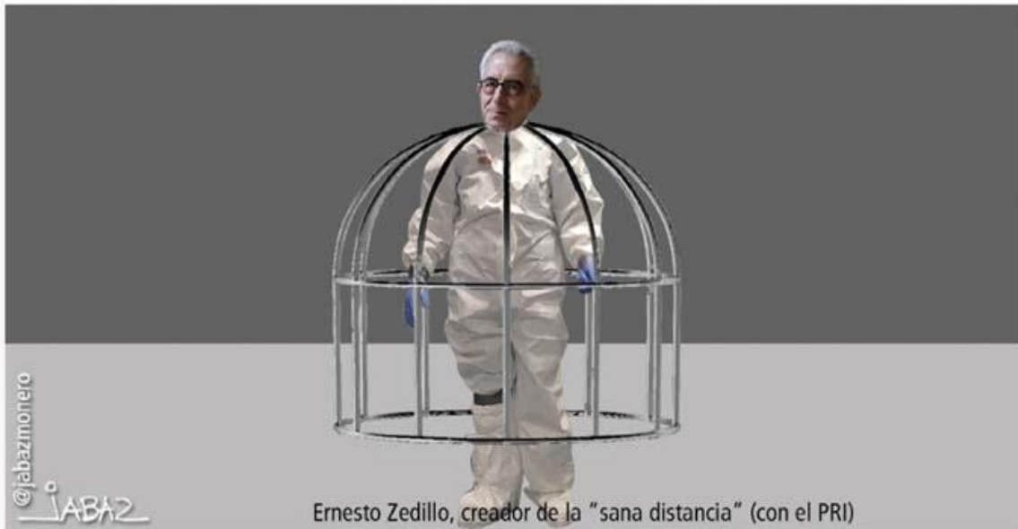
Ernesto Zedillo, creador de la "sana distancia" (con el PRI)